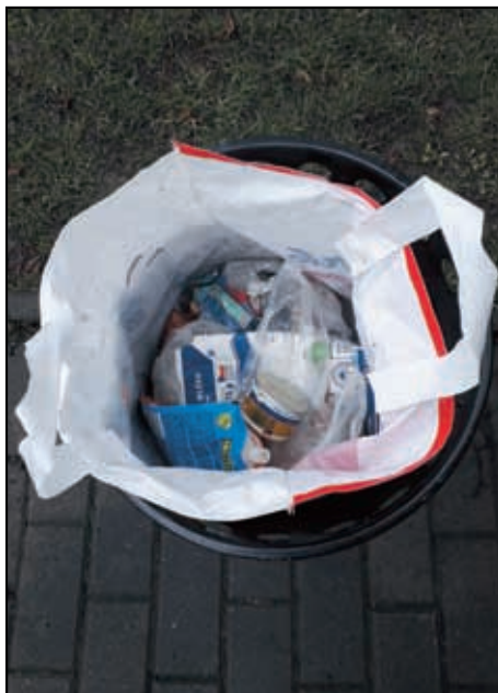
Odpad z domácnosti vhozený v koši na veřejném prostranství