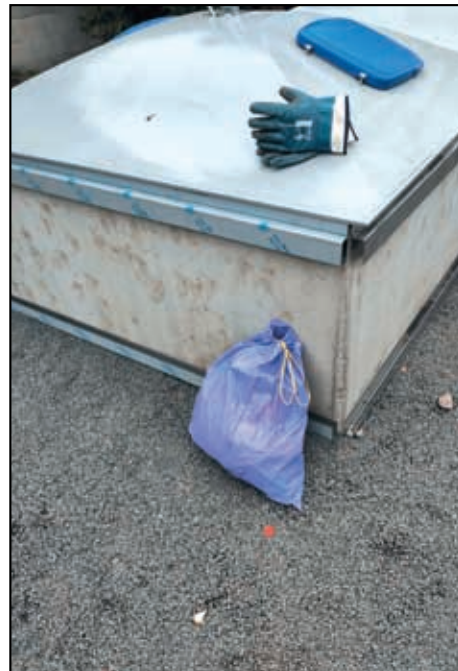
Směsný komunální odpad u kontejnerů na tříděný odpad

Milý čtenáři, přejeme vám krásné velikonoční svátky, doufejme, že počasí bude přívětivé a dopřeje nám pohodu slunečních paprsků.