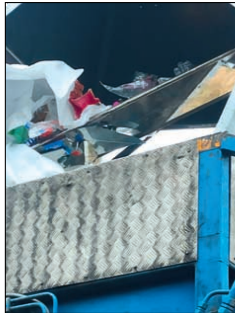
Sklo vhozené do kontejneru na plasty